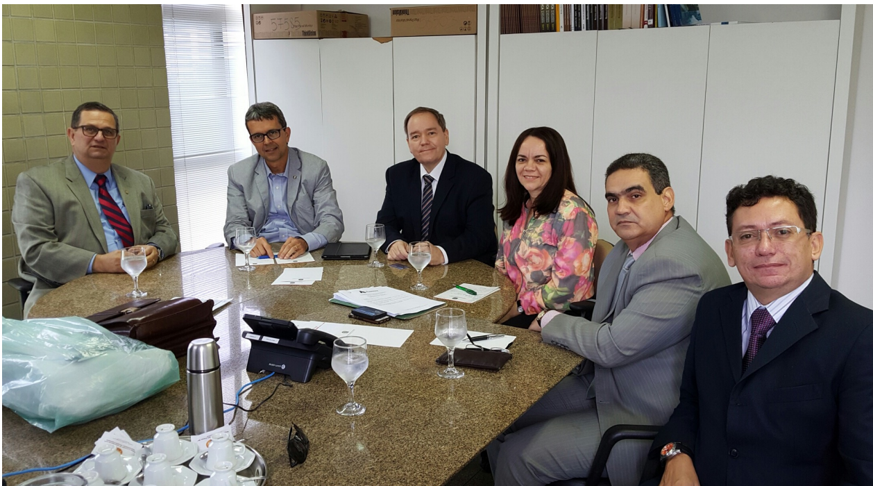
Presidente del Grupo IBA en la reunión de la organización de la IOJT www.iojt2015-brazil.com

6 – IOJT: La organización internacional para la formación de jueces - IOJT, organiza este año una conferencia en la playa de Porto de Galinhas, Brasil. Esto es gran evento para la formación y la educación continua de los jueces. La UIM argumenta que no hay derechos humanos sin juez independiente. Y el juez sin formación no tiene independencia, siendo tan importante la Conferencia de la IOJT. La presidencia del grupo IBA participó en reunión de este mes con la organización de la IOJT en Brasil. Más información www.iojt2015-brazil.com