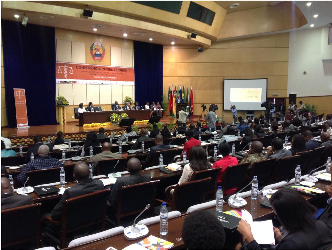
Conferencia Internacional en Mozambique con jueces africanos de lengua portuguesa