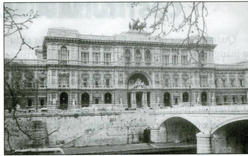
Palazzo di Giustizia, Roma, Italia

«L'Association Internationale est une création pleine des plus séduisantes promesses; notre Union fédérale lui souhaite longue vie et plein succès.»