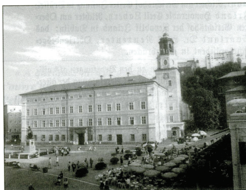
Residenz, in Salzburg. In this building IAJ was funded. Dans ce bâtiment UIM était fondée