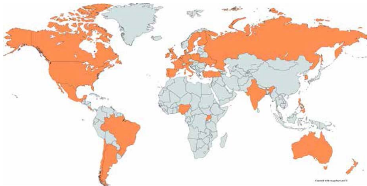
Figura 1: Países del estudio en un mapamundi

Argentina, Australia, Austria, Bélgica, Brasil, Canadá, Chile, Costa Rica, Dinamarca, Inglaterra, Finlandia, Francia, Alemania, India, Irlanda, Italia, México, 14 Países Bajos, Nueva Zelanda, Nigeria, Filipinas, Polonia, Portugal, Rusia, Corea del Sur, España, Suecia, Turquía, Ucrania, Uganda y los Estados Unidos.